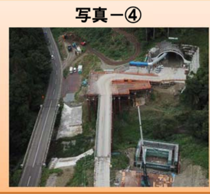
写真-③ 蕨生地区 かんきよ ・函渠工事をしています。 写真-④ 下唯野地区 ・橋梁下部工事をしています。