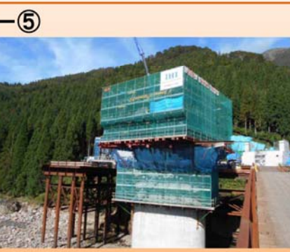
写真-⑤ 下山地区 ・橋梁下部工事をしています。