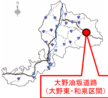
大野油坂道路 (大野東・和泉区間)