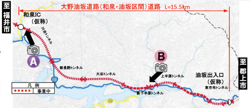
大野油坂道路（和泉～油坂区間）工事状況