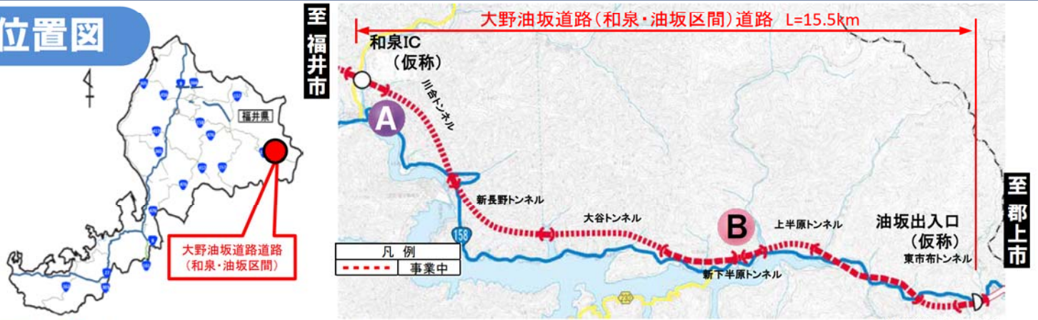
大野油坂道路（和泉～油坂区間）工事状況