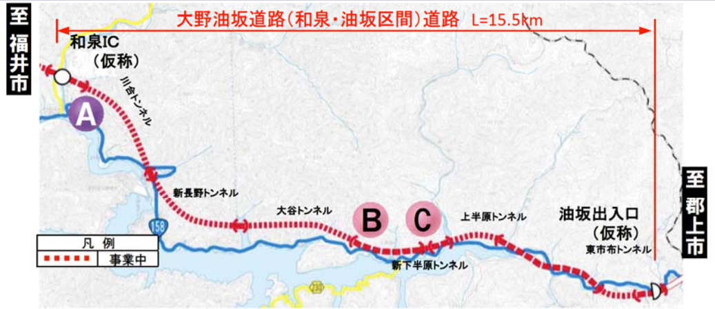
大野油坂道路（和泉～油坂区間）工事状況