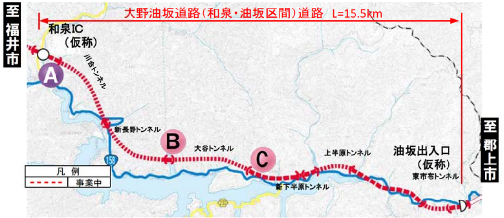
大野油坂道路（和泉～油坂区間）工事状況