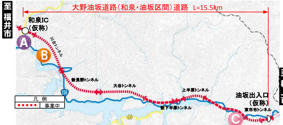
大野油坂道路（和泉～油坂区間）工事状況

※表示は本線部分の進捗を示したものです ※横式図のため現場状況と一致しない場合があります