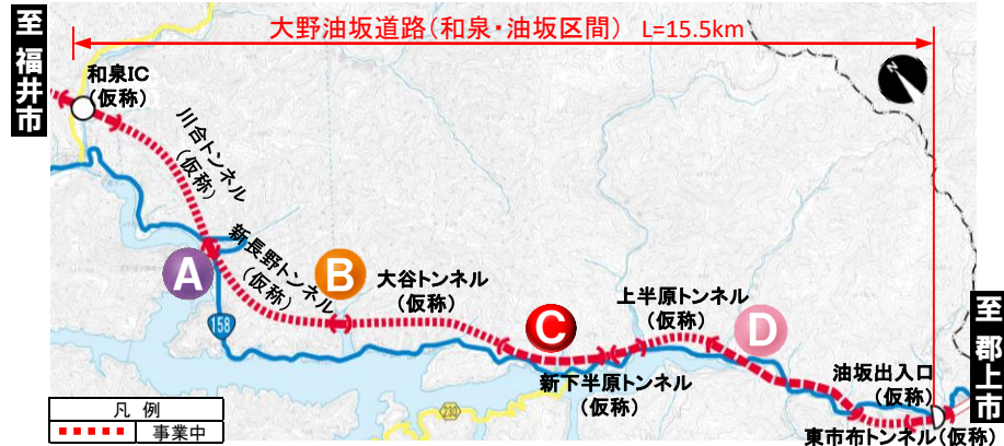
大野油坂道路（和泉・油坂区間）工事状況