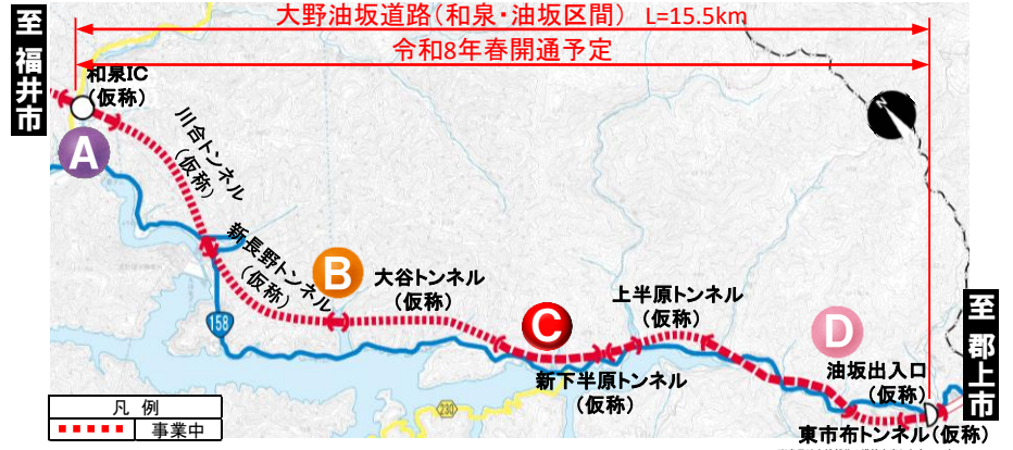
大野油坂道路（和泉・油坂区間）工事状況