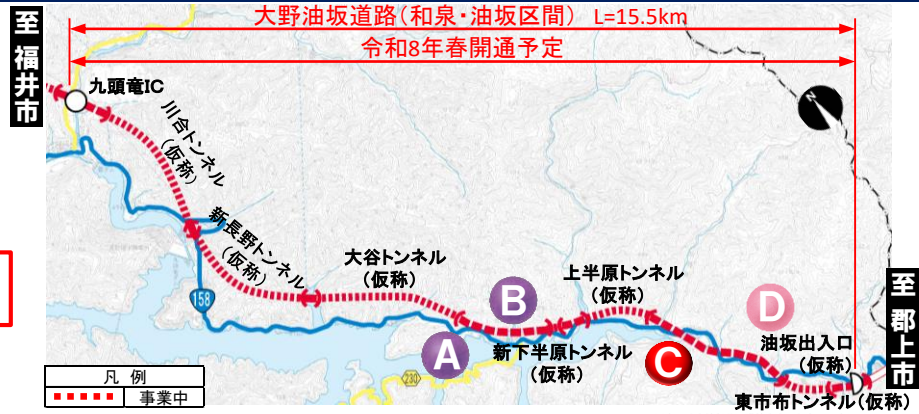
大野油坂道路（和泉・油坂区間）工事状況

※表示は本線部分の進捗を表したものです ※模試図のため現場状況と一致しない場合があります