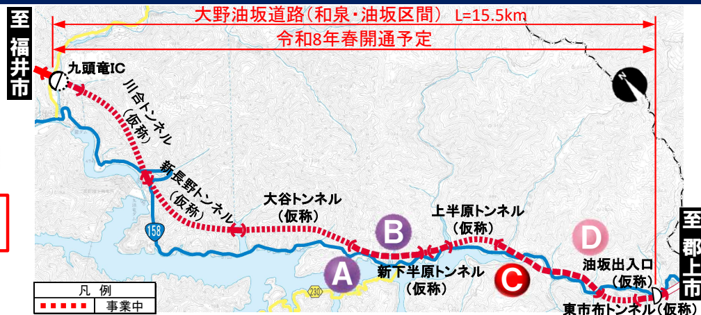
大野油坂道路（和泉・油坂区間）工事状況

※表示は本線部分の進捗を表したものです ※模式図のため現場状況と一致しない場合があります