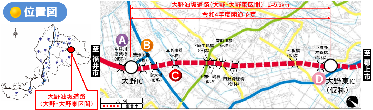
大野油坂道路（大野・大野東区間）工事状況