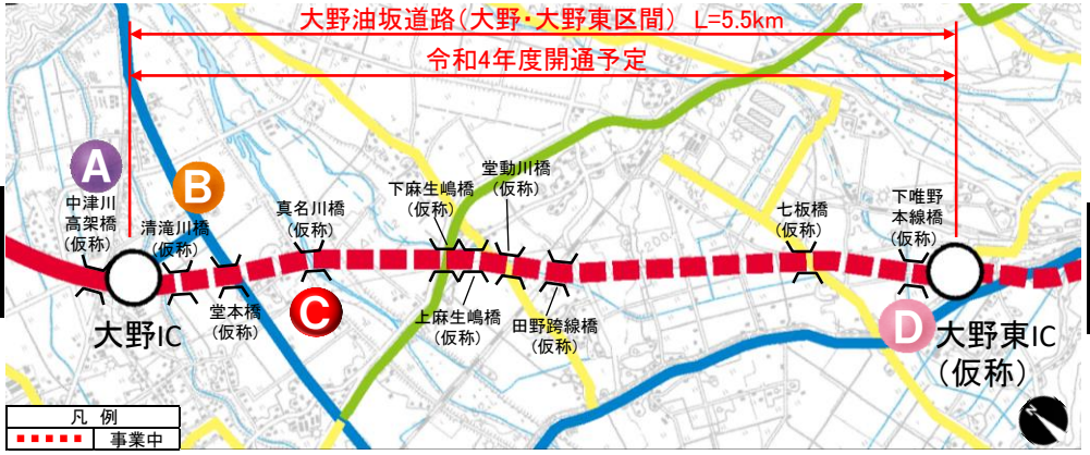
大野油坂道路（大野・大野東区間）工事状況