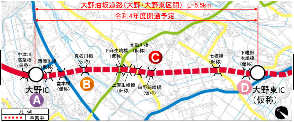
大野油坂道路（大野・大野東区間）工事状況