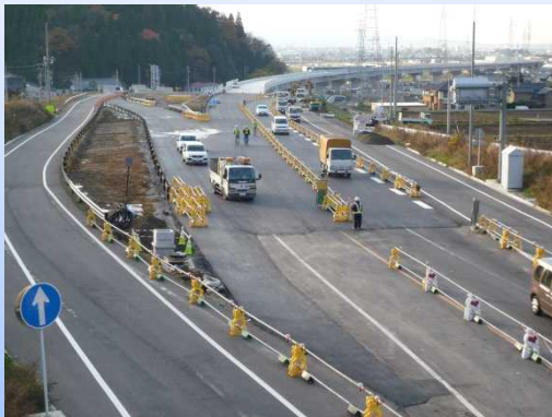
写真-3 松岡IC(仮称)工事を進めています。