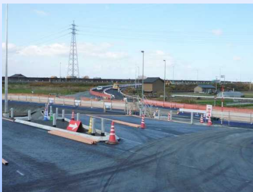
写真-4 福井北JCT(仮称)工事も着々と進行。