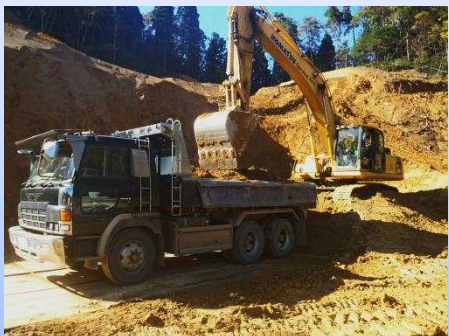
写真-4: 山を切り開いて、土砂を取り除く改良工事を行っています。