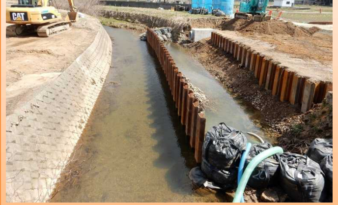
写真-3: 権世川橋の下部工事が完成しました。