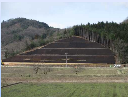
写真-4: 笹岡地区の切土工事が一部完成しました。