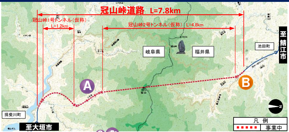
冠山峠道路工事状況