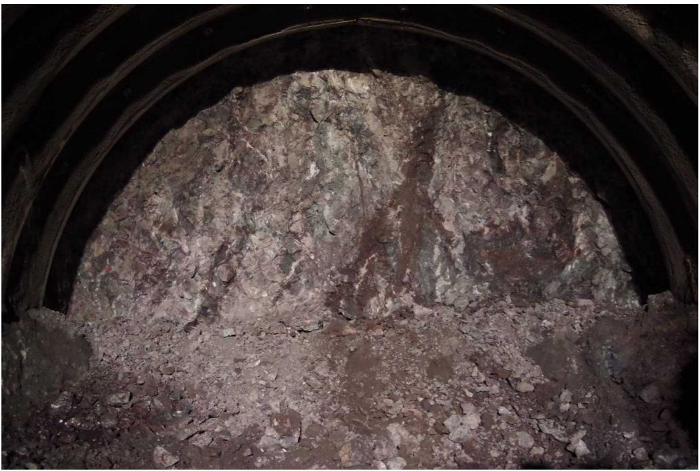
※冠山峠2号トンネル(仮称)は、平成26年6月30日から掘削に着手しました。