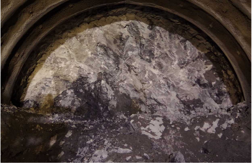
※冠山峠2号トンネル(仮称)は、平成26年6月30日から掘削に着手しました。