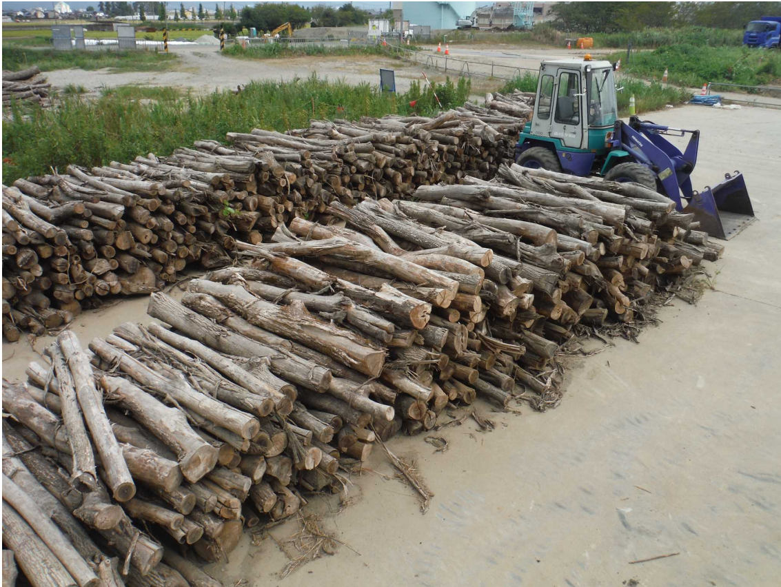
受取樹木（福井市黒丸町地先）