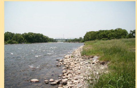
水際には、水辺に近づける石礫の河原もあり日帰りキャンプも楽しめます。