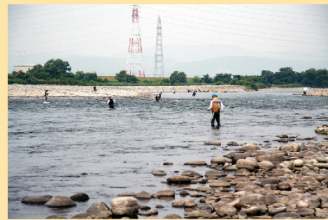
五松橋周辺は、シーズンには釣り客で賑わいます。