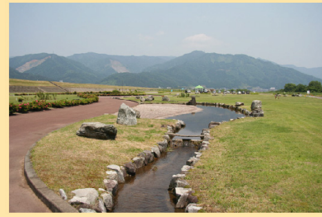
マレットゴルフ場にはせせらぎ水路も整備されています。