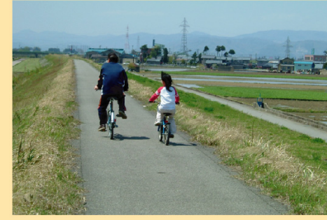
堤防上は自転車道路となっています。上流側は、鳴鹿大堰まで続きます。