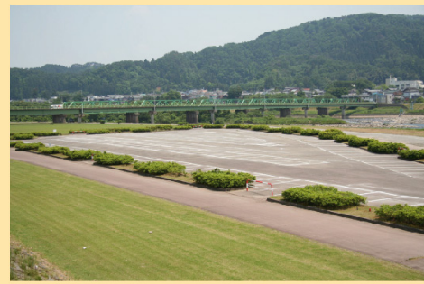
自動車の進入も可能で、駐車場も整備されています。