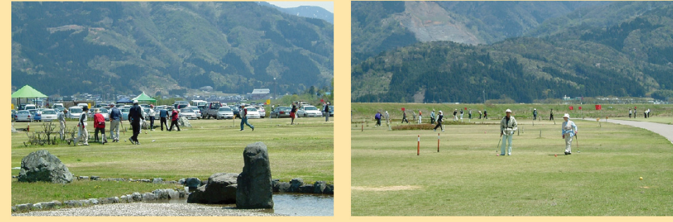
マレットゴルフ場には、いつもたくさんの方が訪れ、スポーツを楽しんでいます。