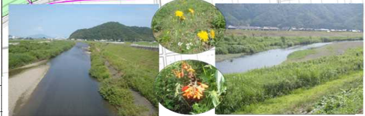
緩やかに蛇行する流れ、礫河原、草花と周りの田園が一体となった風景が広がる。