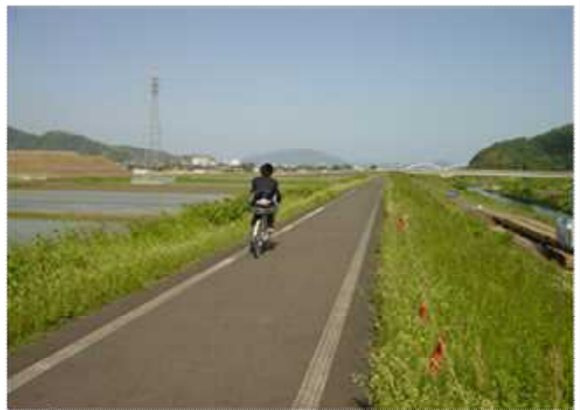
生活道としての利用（通勤、通学等）