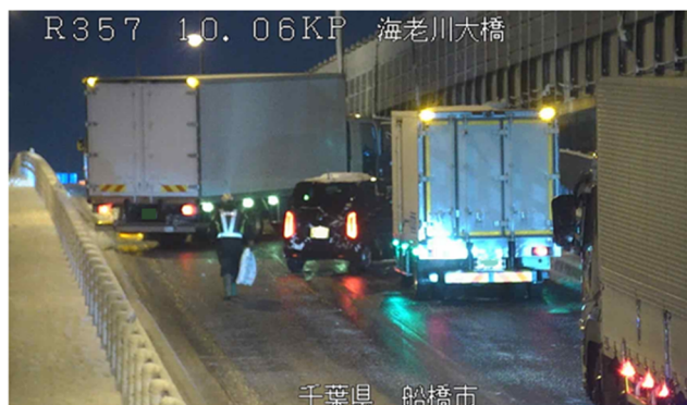
冬用タイヤやチェーン未装着車両による スリップ事故