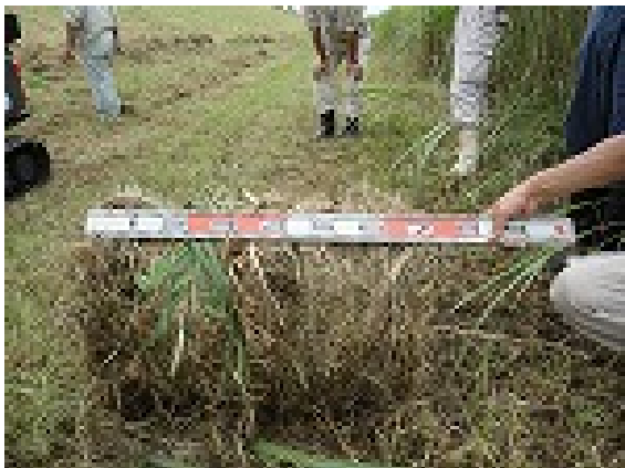
ロールにした状態