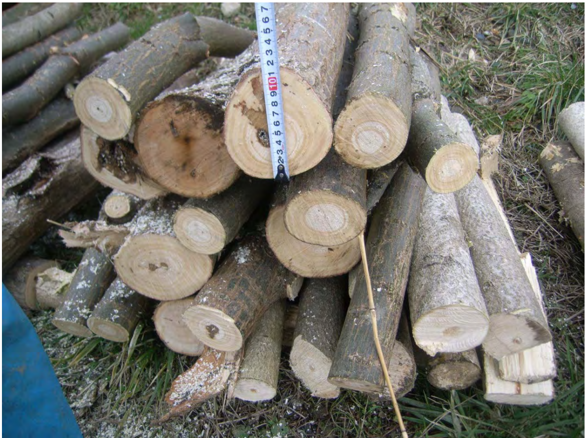
無償配布用 伐木写真