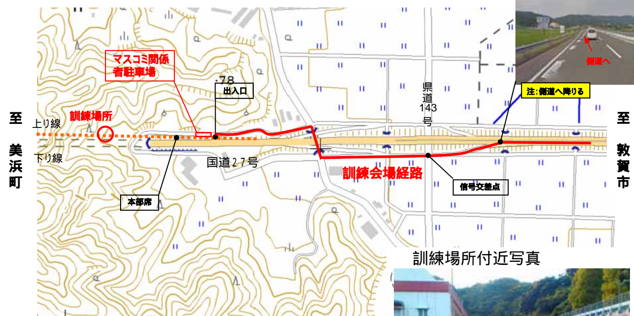
訓練場所付近写真