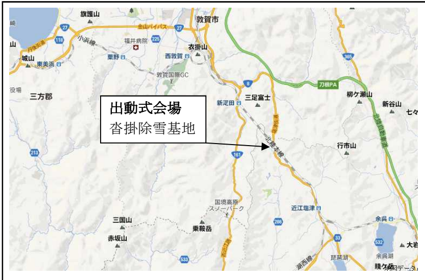
沓掛除雪基地配備除雪機械一覧