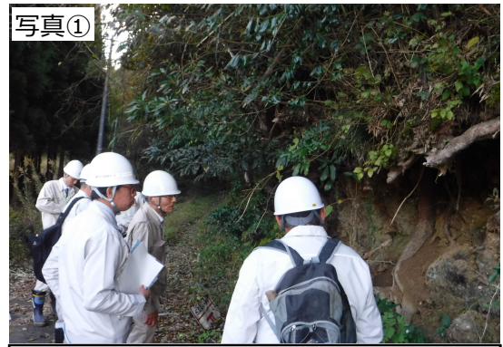
特に対策が急がれる範囲で現地の確認