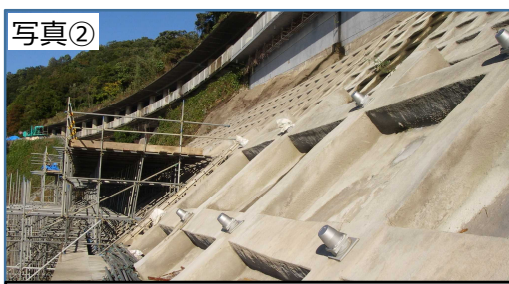
短期的な防災対策「法面保護工」の状況

短期的な防災対策箇所の「法面保護」を実施中。スタック対策についても順次、実施予定。