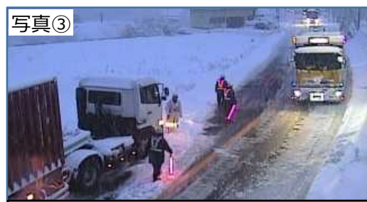
過去のスタック状況（H27.2.10）