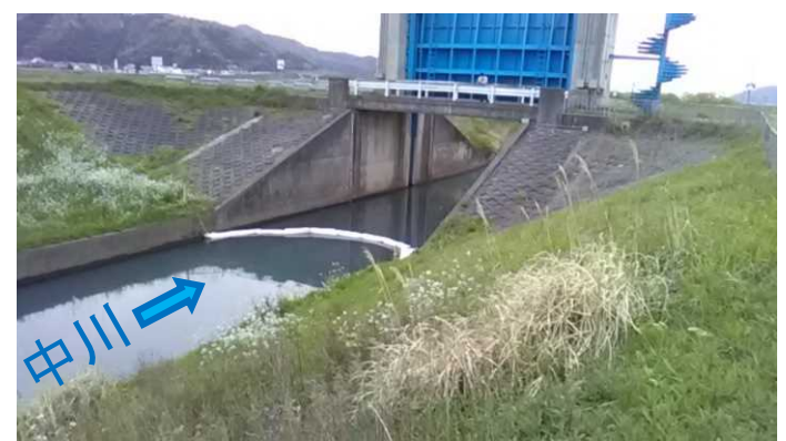
オイルフェンス設置状況 (中川水門)