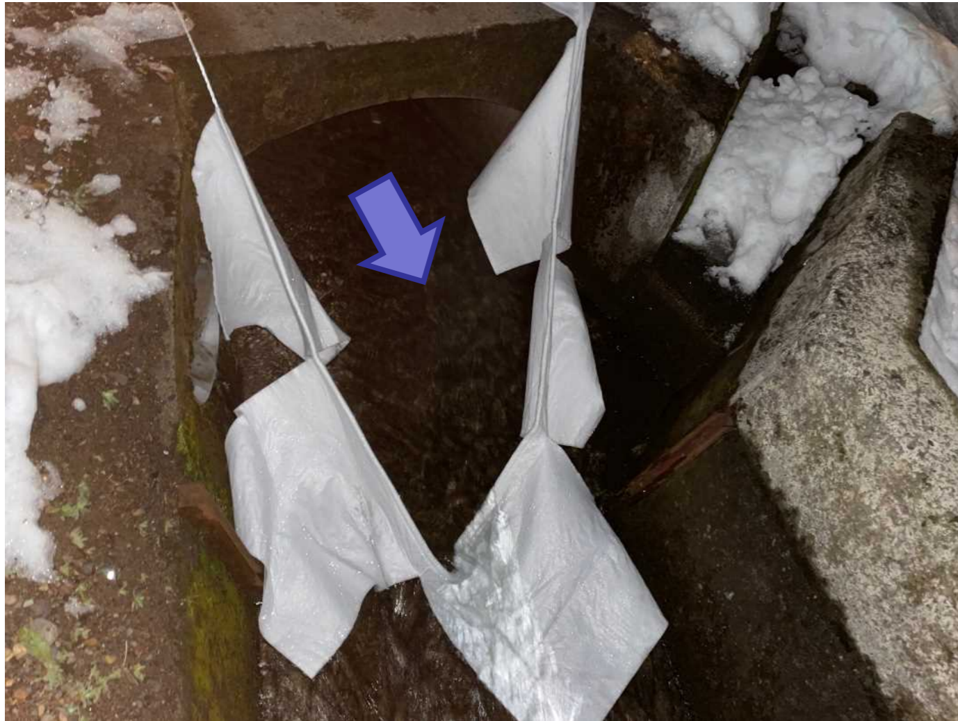
日野川に流入する水路の油膜確認箇所 (南越前町今庄付近)