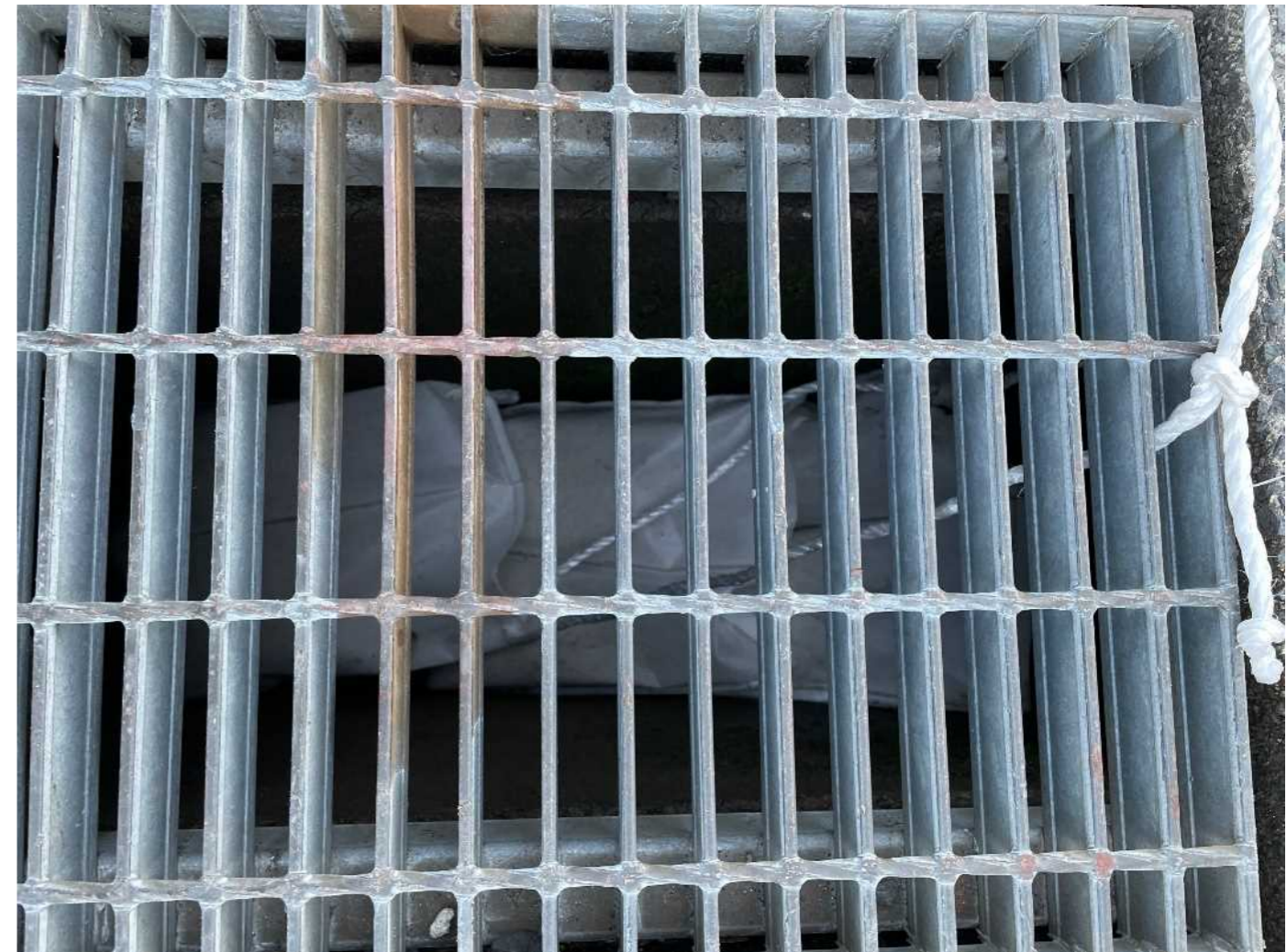
事故発生現場付近の対策状況 (南越前町今庄 事故発生地点付近)