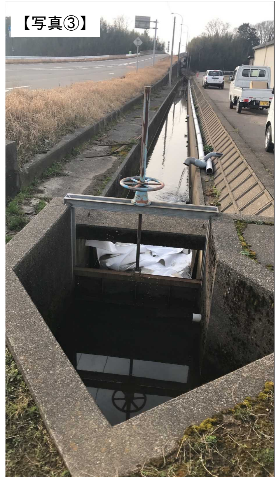
農業用水路での対策状況 (坂井市三国町下野)