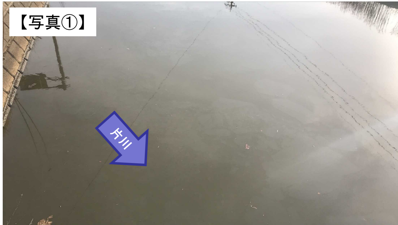
片川の油膜状況(三国町下野)