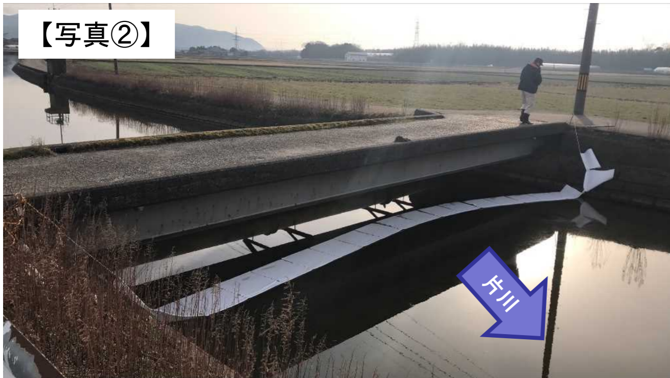
農道橋での対策状況(坂井市三国町下野)