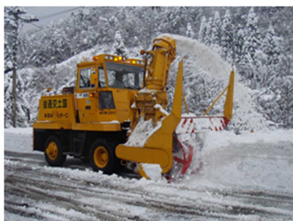
ロータリー除雪車