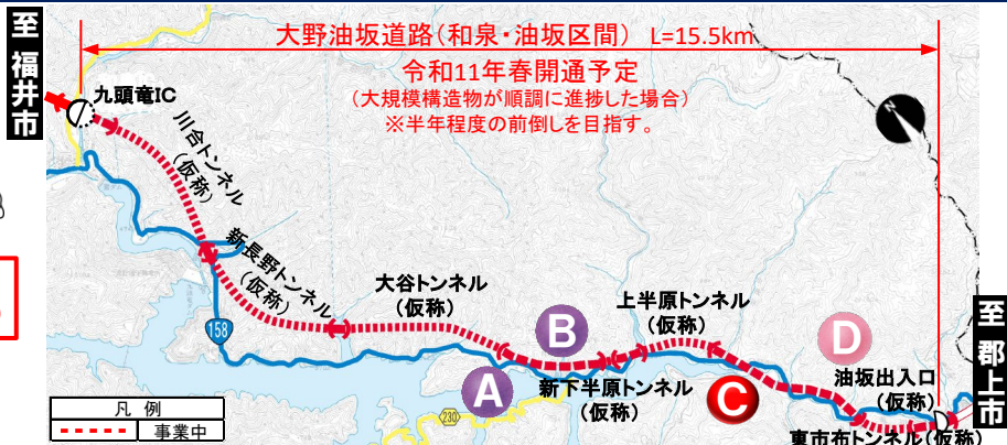
大野油坂道路(和泉・油坂区間) 工事状況