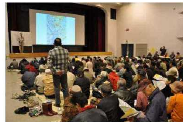
地域住民への周知（説明）イメージ