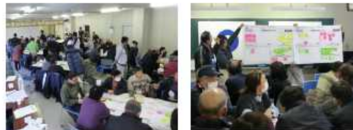
自主防災組織が主体となった防災計画策定の状況