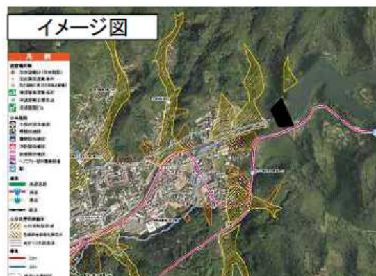
ダム下流区間ハザードマップ作成イメージ