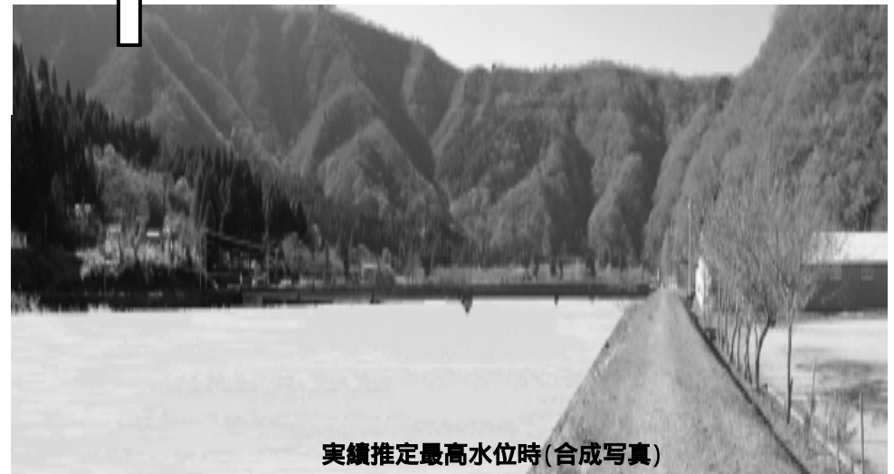
実績推定最高水位時(合成写真)