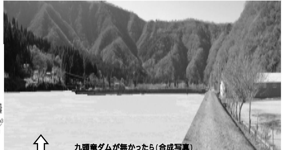
九頭竜ダムが無かったら(合成写真)