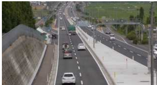
6月：金山バイパス、美浜東バイパスが完成供用