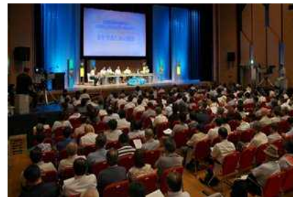
7月：問い直そう福井豪雨の教訓（県民公開シンポジウムを開催）