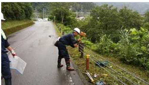
9月：大野油坂道路（和泉・油坂）用地幅杭を打設