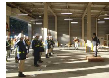
11月：除雪出動式を挙行政 ～今冬の除雪体制が始動～