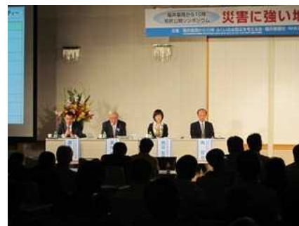
10月：災害に強い地域を目指して（県民公開シンポジウムを開催）