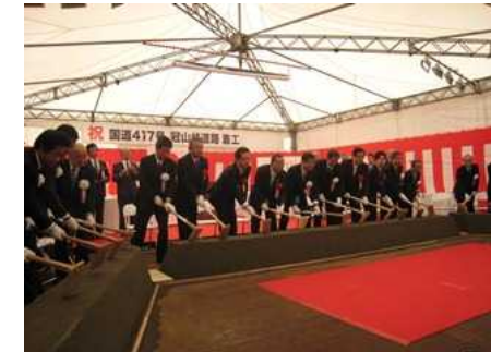
5月：冠山峠道路着工式を挙行政