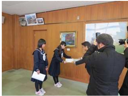
2月：河川愛護協力者の感謝状授与式を挙行政