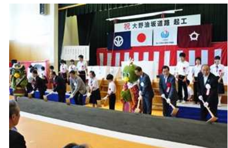
8月：大野油坂道路起工式を挙行政