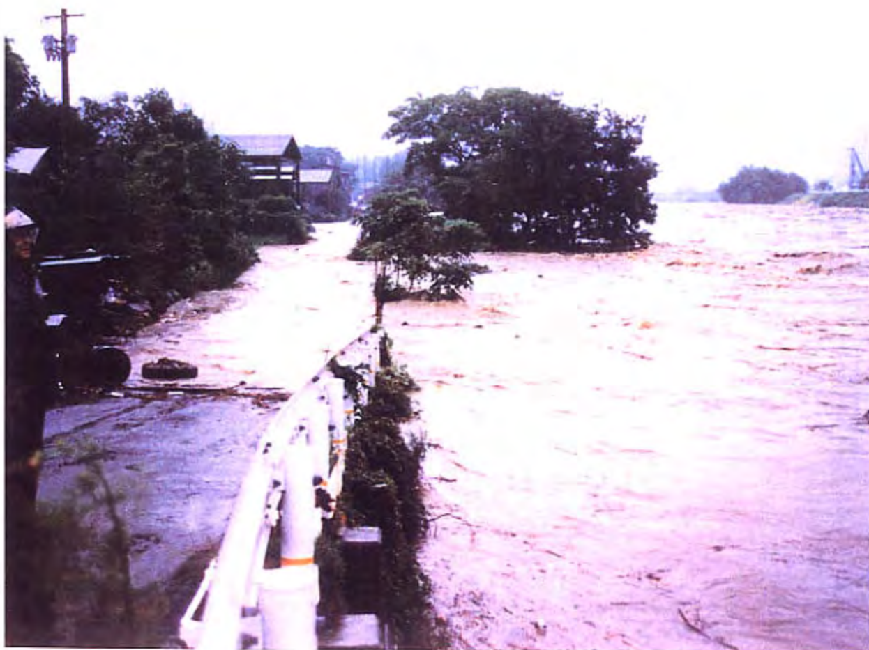
4. 揖保川本川130.2km付近穴栗橋の潜没状況を下流右岸から望む