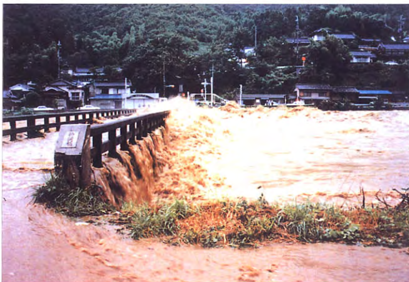
2. 揖保川本川34.8km付近神河橋橋面越流状況を右岸下流から望む