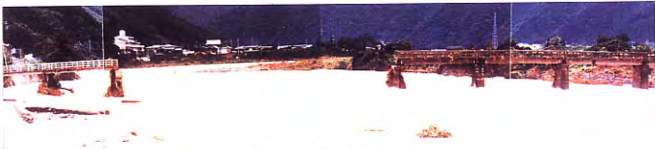
3. 揖保川本川134.8km付近神河橋の落橋状況を下流右岸から望む