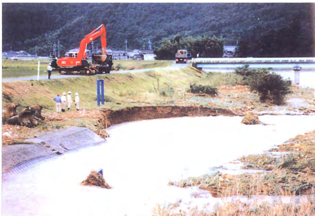
1. 支川栗栢川3.6km付近左岸低水路河岸の崩壊状況を上流側段ノ上橋から望む