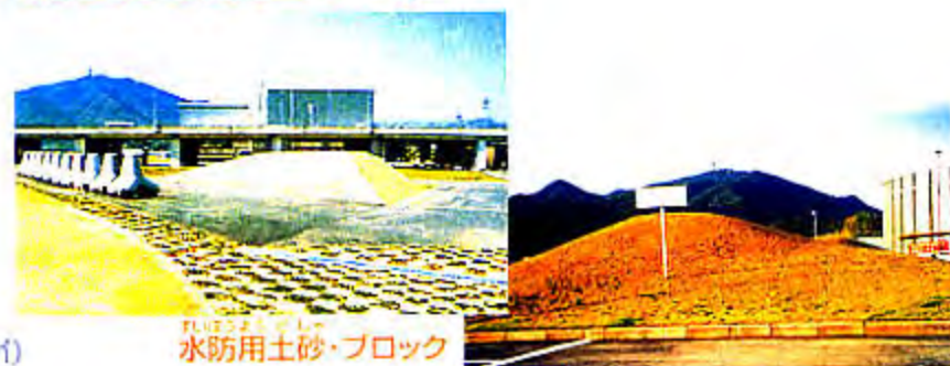
水防用土砂・ブロック

水防用土砂 河川防災ステーションでは、水防活動に必要な資材などを備蓄しています。