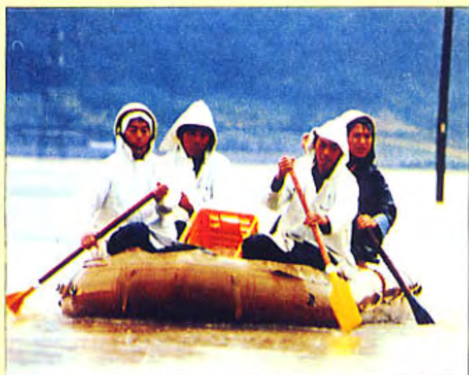
濁流の中、物資を運ぶ救援隊