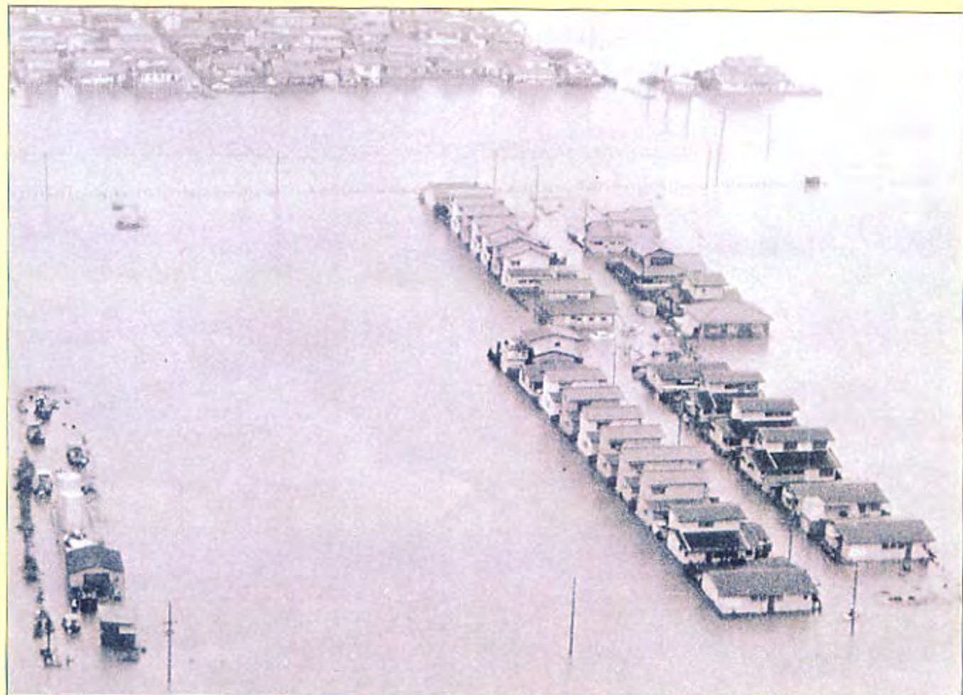
集中豪雨にみまわれ孤立した民家