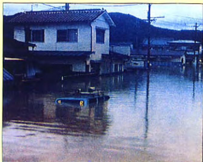
洪水で水没した自動車