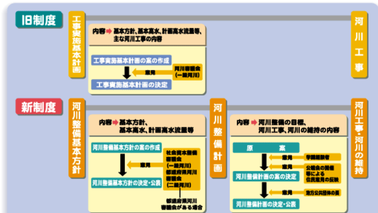
図-2 新しい河川整備の計画制度