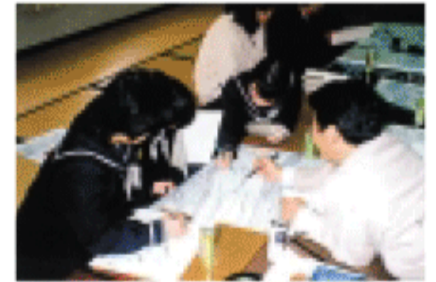
トンボ池検討会の様子