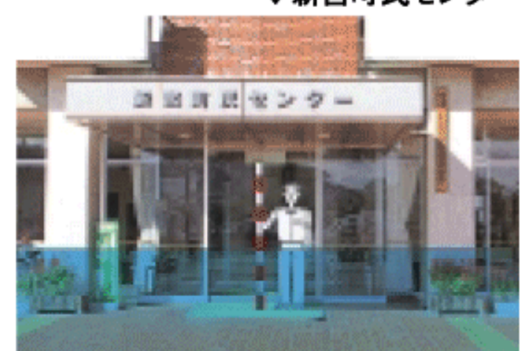
▼ 新宮町民センター

◆概ね100年に1回程度起こる大雨に見舞われたとき、龍野市立図書館のあたりでは深さ2m以上、新宮町民センターでは50cm以上の浸水が想定されています。