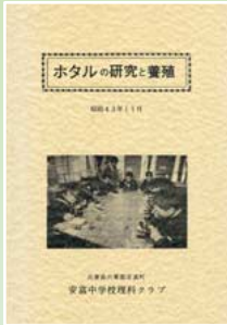
◀ホタル研究をまとめた冊子 昭和43年11月

の理科クラブ員の取り組みがその原点です。この理科クラブの研究は昭和51年度まで続けられました。その後、取り組みに共感する町民の方々により、河川清掃やホタル保護地区の指定による捕獲禁止など、ホタル保護の取り組みに受け継がれました。川の汚れで一時減少していたホタルの数もすたいに増えはじめ、現在では毎年、幻想的な光の舞を見ることができるようになりました。