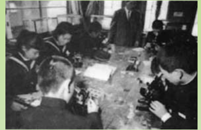
▲当時の理科クラブの様子(安富町HPより)

「花とホタルのまち」という安富町のキャッチフレーズは、昭和41年6月、ホタルの研究と養殖を開始した安富中学校の1人の先生と9人の