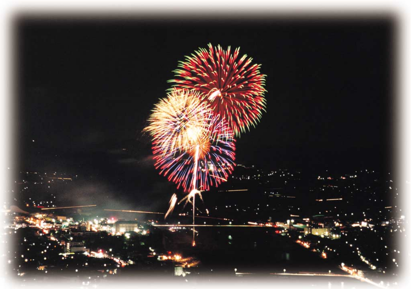
龍野市 金輪山より