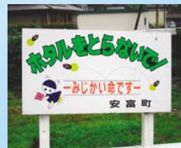
▲ホタル捕獲防止看板 (町内の11ヶ所に設置)