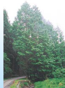
▲メタセコイヤ並木 生ける化石として有名。 スギ科の落葉高木で高さは35mにもなります。