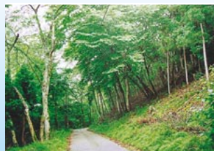
▲ケヤキ並木の中を歩く 日本を代表する広葉樹のひとつ。

揖保川源流部の、阿舎利山 あじり の森を訪ね、植物や動物を調べながら、自然の神秘に触れました。途中でアマゴの産卵に出くわし、貴重な体験をすることができました。