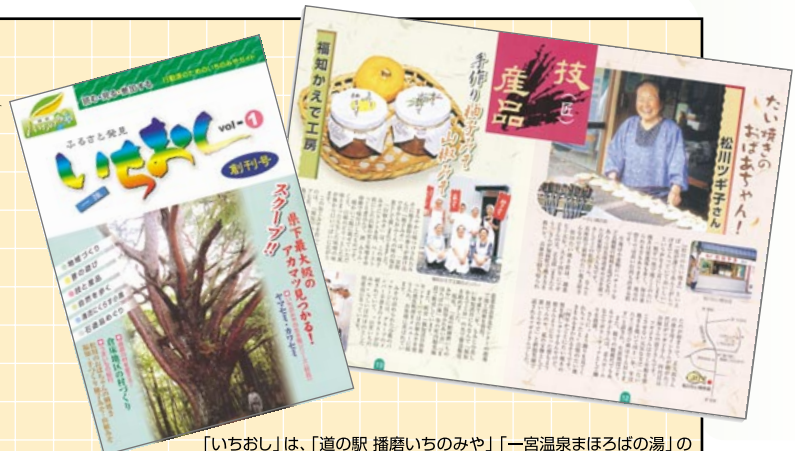
「いちおし」は、「道の駅 播磨いちのみや」「一宮温泉まほろばの湯」の売店などで販売しています(100円)。

一宮町では、地域資源を再発見し、次世代へと伝えていくために「いちおし」という情報誌を平成15年5月に発刊しました。この情報誌の特徴は、テーマごとに編集委員を地域住民から募集し、住民自らが企画し、情報を集め、記事の執筆まで行っているところです。テーマは「地域づくり」「昔の遊び」「技と産品」「自然を歩く」「清流にくらす小鳥」「石造品めぐり」の6つ。現在、編集委員と役場とが協力して第2号を編集中です。