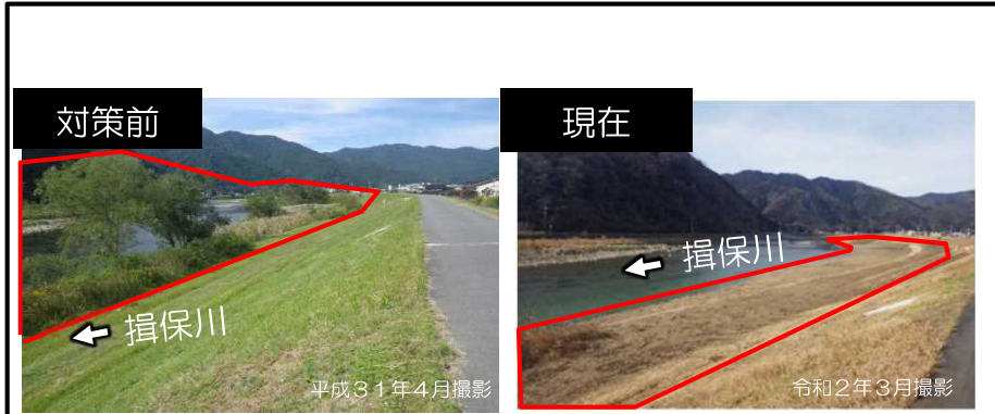
揖保川における河道掘削 (宍粟市)