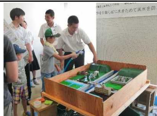
県立龍野北高校作成の総合治水 模型を用いた生徒による出前講座