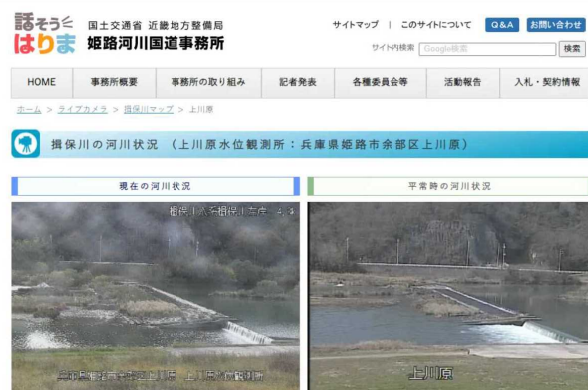
河川監視カメラ画像の配信 (姫路市)