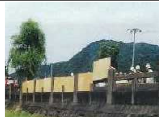
豊堤での水防訓練 (たつの市)