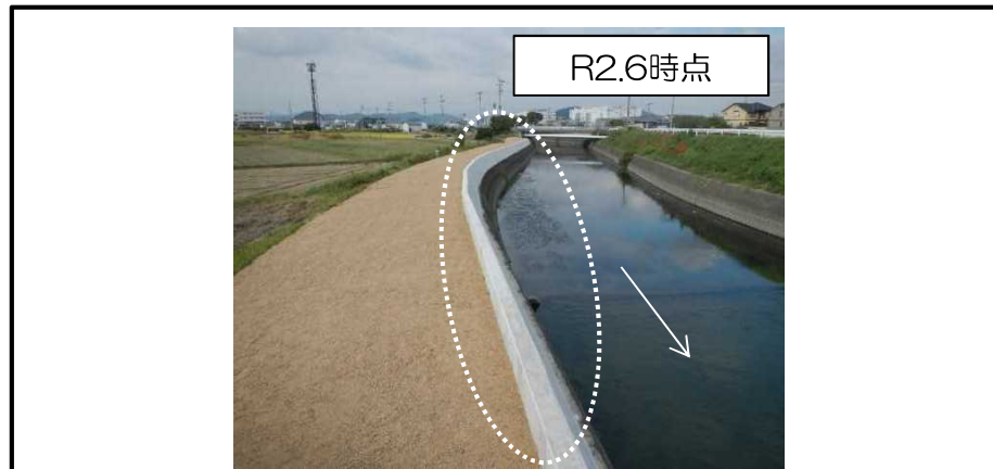
ばんどう 蟠洞川における護岸整備 (姫路市)