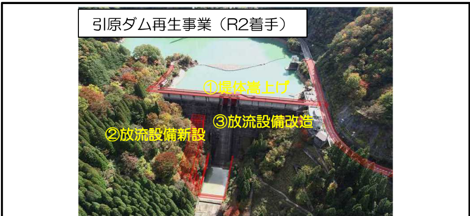
引原ダム再生 (宍粟市)