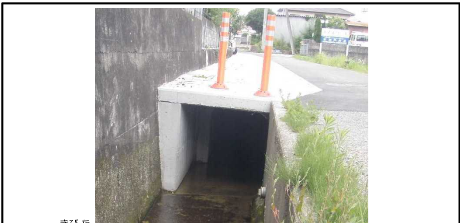
きびた 黍田雨水幹線の整備 (たつの市)