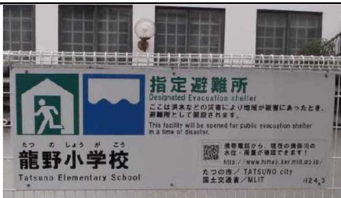
避難所の看板掲示状況 (たつの市)