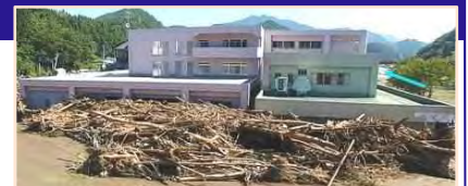
平成28年台風10号により、岩手県の要配慮者利用施設では利用者9名の全員が死亡。