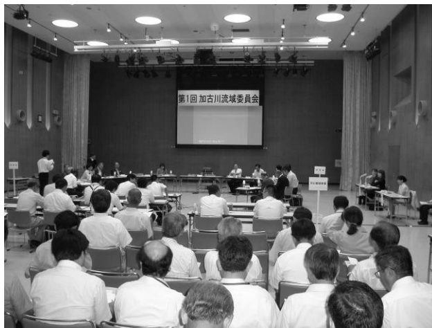
合計 65 名の方の参加をいただきました。

加古川流域委員会設立準備会議において審議・選出された委員 17 名について司会から紹介されました。委員は以下の通りです。