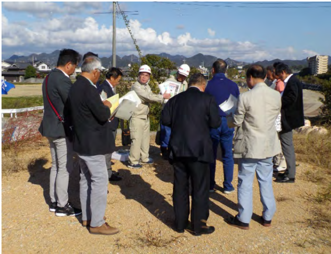
滝野地区事業説明