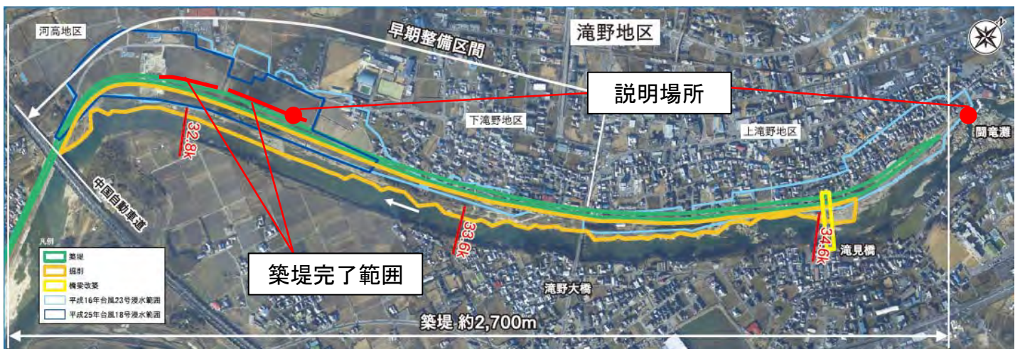
緊急対策特定区間