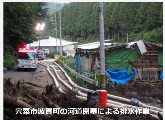
宍粟市波賀町の河道閉塞による排水作業

兵庫県宍粟市波賀町道谷（県道大屋波賀線48号）で発生した地滑りに伴う河道閉塞箇所の排水作業を昼夜継続して実施し、生活道路でもある地方道の早期復旧に貢献。