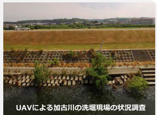
UAVによる加古川の洗掘現場の状況調査

平成30年7月豪雨による加古川の出水に際し、兵庫県小野市河合中町において、堤防法尻の洗掘が発見されたことを受け、応急対策を実施。UAV（ドローン）による被災状況の把握を行い、調査結果から復旧に向けた検討を迅速に進めることが可能となり、一連の復旧工事に貢献。