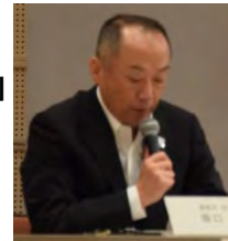
姫路市 坂口防災審議監