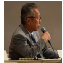
たつの市 山本市長