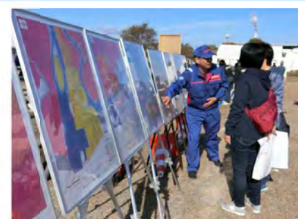
浸水想定区域図の説明も行いました