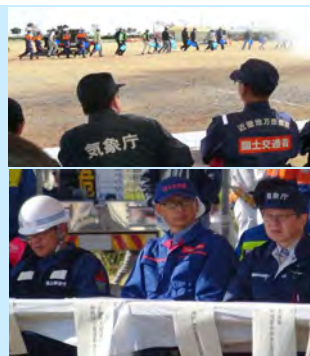
関係機関と共に訓練の状況を確認する北野河川副所長