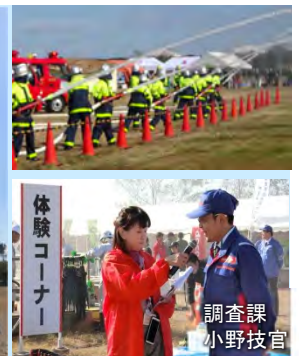
訓練中に浸水歩行体験の生PRも行いました